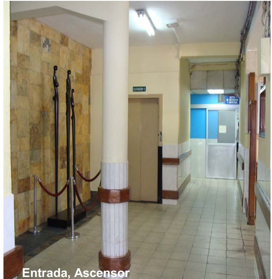
Entrada, Ascensor Nutrición Pasillo hacia Laboratorio y Consultas