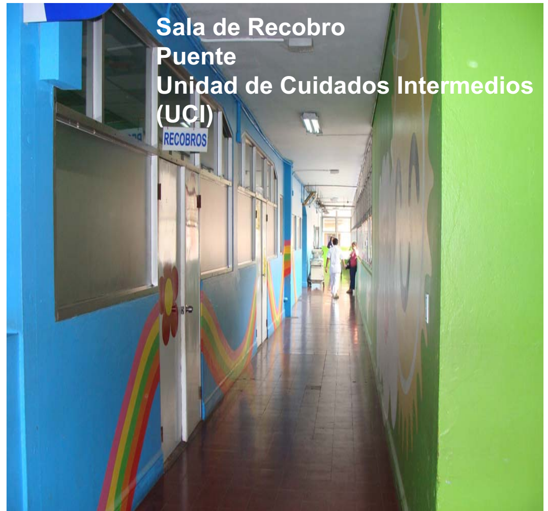
Sala de Recobro Puente Unidad de Cuidados Intermedios (UCI)