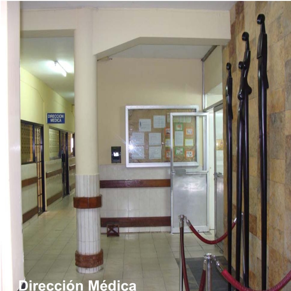
Dirección Médica Farmacia, Fisioterapia, Almacén, Lavandería, Mantenimiento