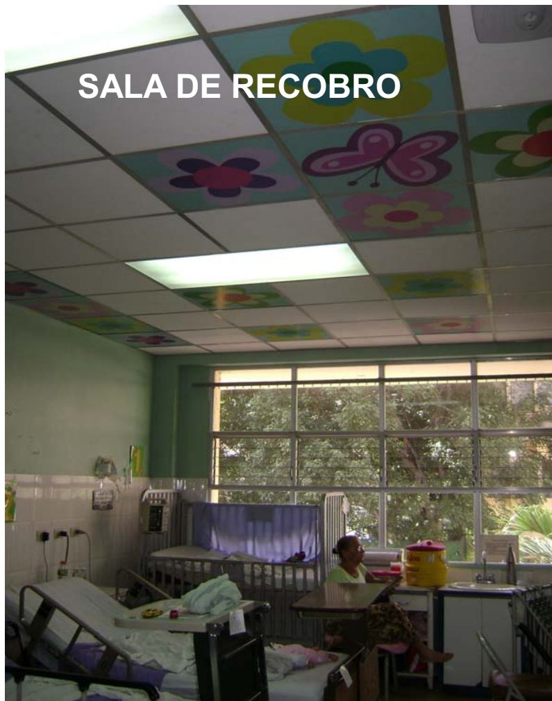
SALA DE RECOBRO